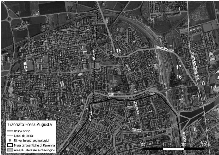
Fig. 3: Ravenna città. Basso corso della Fossa Augusta. Proposta del tracciato con indicazione dei ritrovamenti e aree di interesse archeologico. C-15) Prima Ravenna (RA), Torre dell'Acquedotto/via di S. Alberto. Necropoli e tracce di canalizzazione; 16) Mausoleo di Teodorico; 17) via Pomposa, imbarcazione tardoantica; 18) via Porto Coriandro, infrastruttura portuale

Allo stato attuale delle conoscenze non si è ancora in grado di ricostruire in ogni suo tratto il percorso del canale augusteo. La Fossa Augusta è un'opera realizzata per il controllo delle acque del Po e per facilitare la navigazione interna. Per tale ragione doveva essere alimentata da quel ramo delizio chiamato da Plinio Spinetico o Vatrenico, individuabile nell'area delle valli di Comacchio, e più precisamente nella Valle del Mezzano, non molto distante dal luogo in cui sorse l'abitato di Spina. Il punto di distacco da tale ramo è probabilmente da individuare poco a ovest del sito di Santa Maria in Padovetere e di Motta della Girata, luogo di un probabile approdo fluviale antico. Nel dettaglio è plausibile che la struttura della Fossa sia da riconoscere in quella traccia fossile rettilinea, individuata da Stefano Cremonini grazie all'osservazione delle fotografie aeree 37 , che si distacca dalla destra dell'Eridano per poi puntare in direzione sud verso Baro Zavelea, luogo interpretato già in passato da Giovanni Uggeri come uno dei siti chiave per l'individuazione del tracciato del canale augusteo 38 .