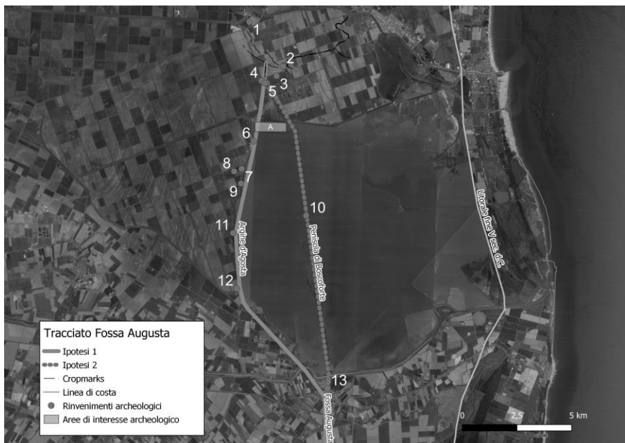
Fig. 1: Valli di Comacchio (FE). Alto corso della Fossa Augusta. Proposte del tracciato lungo l'argine di Agosta e lungo l'argine Fossa di Porto, con indicazione dei ritrovamenti e aree di interesse archeologico.

segnalazione della presenza della Fossa Augusta per chi proveniva da ovest sul Po e recentemente oggetto di nuovi studi e indagini 22 . Poco distante, si trova l'importante sito tardoantico di Santa Maria in Padovetere 23 , organizzato intorno a una chiesa 24 e a un battistero collocati sul dosso denominato "Motta della Girata", nel territorio dell'odierno comune di Comacchio (FE). Poco distante, infine, è il luogo della recente scoperta di due piroghe e di un'imbarcazione fluviale lignea priva di carico, datate tramite C14 rispettivamente tra IV e VII secolo e tra IV e VI secolo d.C. 25 . Gli strati di obliterazione dei manufatti di natura alluvionale documentano durante la Tarda Antichità la riduzione dell'ampiezza dell'alveo del Po, senza tuttavia comprometterne la navigabilità 26 . La scoperta è un importante indizio della presenza di un approdo fluviale e di un vivace traffico commerciale ancora in età tardoantica e medievale nel territorio a nord di Ravenna. L'eco della vitalità di traffici su via terrestre, ma soprattutto fluviale, riecheggia ancora nelle parole di Sidonio Apollinare. (E.R.)