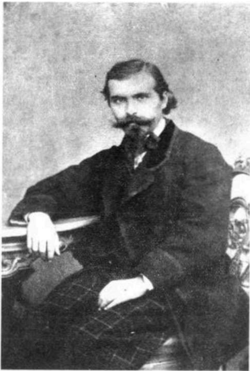
Luigi Luzzatti a 22 anni